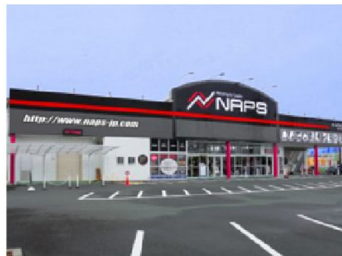
ナプス浜松店外観