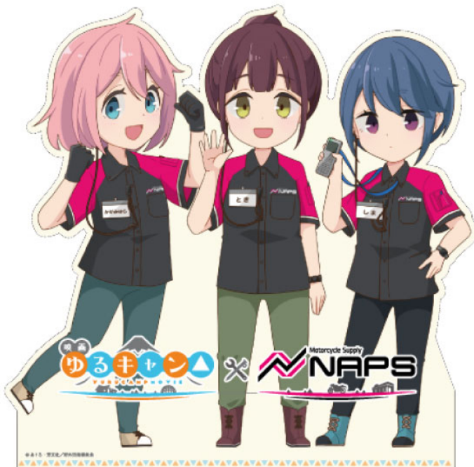
スタンディパネル（全店共通）

浜松店のみ、限定の背景パネルを設置、また、登場キャラクターの志摩リンが劇中で乗車しているモデルとなったオートバイも展示して皆さまのお越しをお待ちしております。