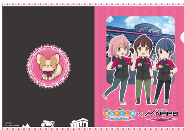
浜松店限定クリアファイル