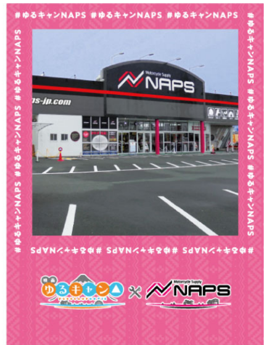
フォトスポット背景（浜松店限定）