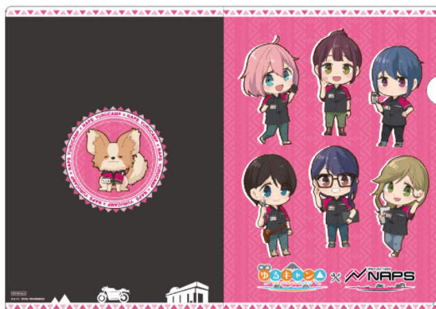
ウェブショップ限定クリアファイル