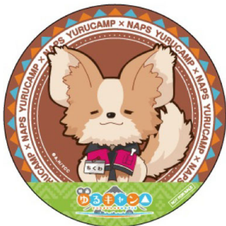
全店共通ちくわステッカー