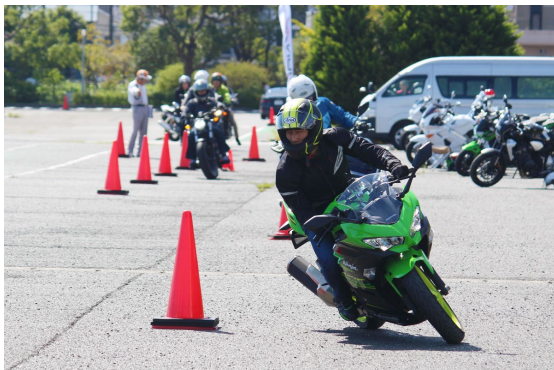
基礎を反復して練習することで苦手意識を克服していきます。