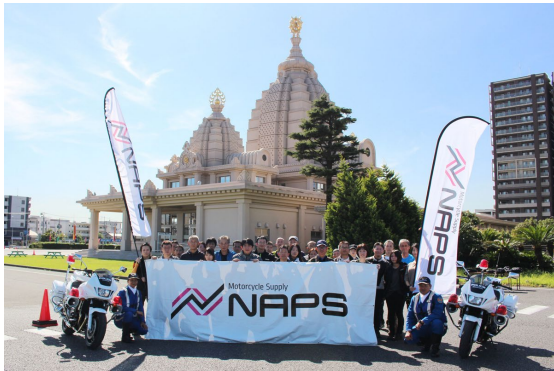
多くの受講者の方にご参加いただきました。