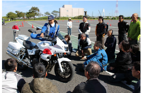
白バイ隊員の方による乗車姿勢や日常点検などの講習が行われました。