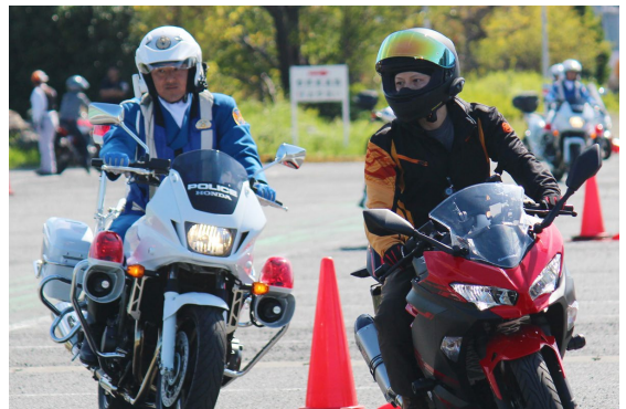
スラローム走行を楽しみつつ更にスキルアップ。