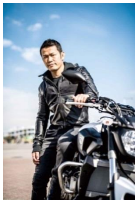
愛車MT-07と須藤元気氏

当イベントは、これまで10年以上開催してきたナップス主催のライダーイベント「NRM（ナップス ライド&ミー ト）」（動員実績：毎年約4,000名）を、須藤元気氏プロデュースの新企画としてパワーアップして開催するものです。当日はジムカーナのトップレベルライダーなどを含めた80名の出場選手たちが、一騎討ちトーナメント方式で競うモトジムカーナ競技にてNo.1を競い合います。また、“クールデビル”と呼ばれたレジェンドライダー原田哲也さんや、SKE卒業生の梅本まどかさんなどによるトークショーや、メーカーのブース出展、ニューモデル試乗会など様々なイベントを実施いたします。