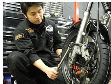
専門スタッフが取り付けます